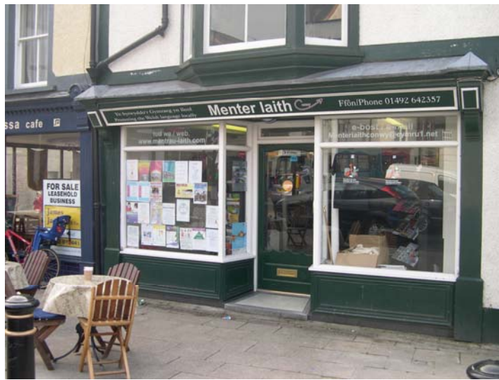
Lleolwyd Adeilad Menter iaith Conwy ar sgwar Llanrwst.